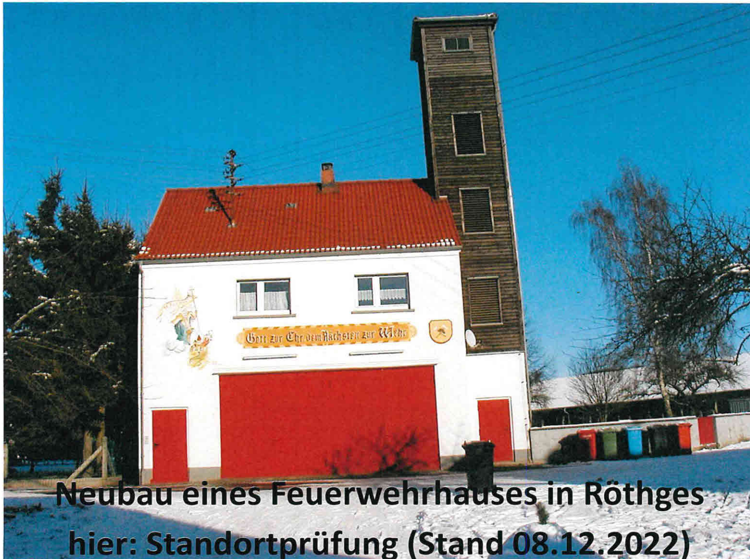
Neubau eines Feuerwehrhauses in Röthges hier: Standortprüfung (Stand 08.12.2022)