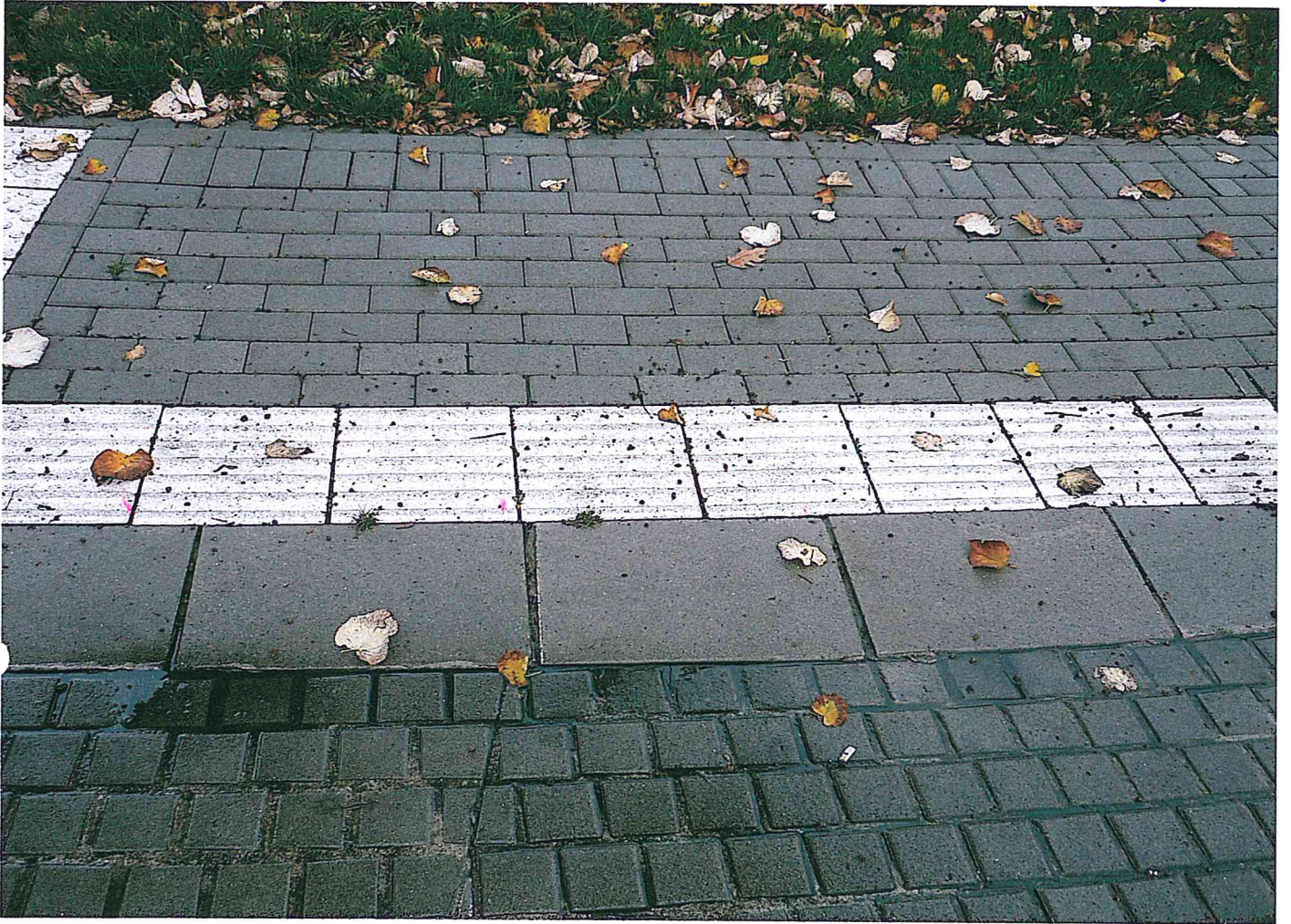
bei Hungerer Strasse